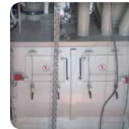
▶ Tiempos de descarga más cortos gracias a la doble boca de descarga