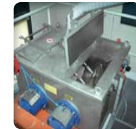
▶ Fácil limpieza