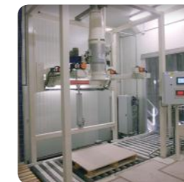
Dosificación y pesaje : automatización y ergonomía del lugar de trabajo