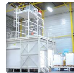
Transporte y almacenaje intermedio dinámico : altas cadencias e implementación flexible