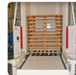
Desapilador con capacidad para 15 palets multi-formato