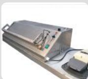
Soldador interno de bags