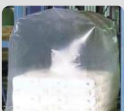
Enfundado del big bag

Vea todas nuestras opciones en la página 28