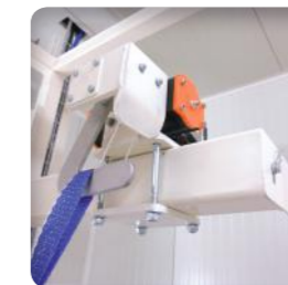
Desenganche automático de las asas, resultando en una alta ergonomía y cadencia