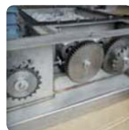
▶ Entraînement pignons par chaîne