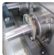
▶ Etanchéité passage d'arbre