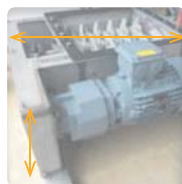
▶ Encombrement réduit